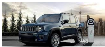
Jeep Renegade 4xe

Alle weiteren Informationen erhalten Sie bei Ihrem Kreisbauernverband